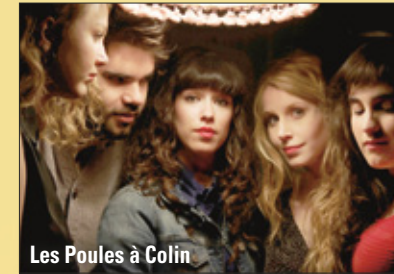
Les Poules à Colin