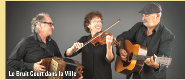
Le Bruit Court dans la Ville