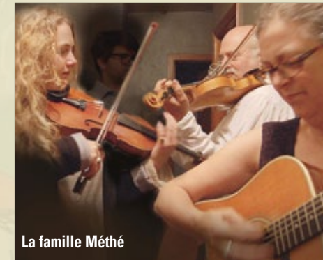
La famille Méthé

Centre d'interprétation de Place-Royale, Salle du Roy 27, rue Notre-Dame, Québec