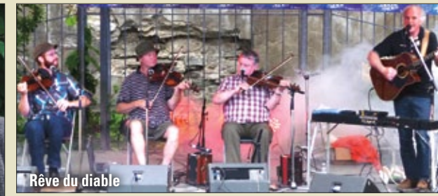
Rêve du diable